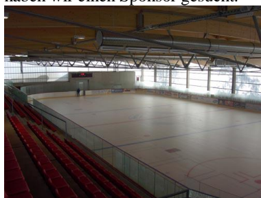
Die Arena strahlt im neuen Glanze

Auch in dieser Saison wird es den Weg nach Kühlungsborn in den Eisdome geben. Voraussichtlicher Start ist November. Also leckt noch etwas die Wunden vom Sommer. Einige unter uns haben beim Hockey Einsatz gezeigt bis die Zehen bluten oder Schürfwunden bekommen. Andere dürfen nur noch mit Vollausrüstung spielen, weil „Mutti“ das gesagt hat. Laut Betreffenden darf ich keine Namen nennen. Hab ich somit auch nicht getan Bell! Durch großes Verhandlungsgeschick konnten wir für dieses Jahr den Eisdome verkaufen. Monate lang haben wir einen Sponsor gesucht.