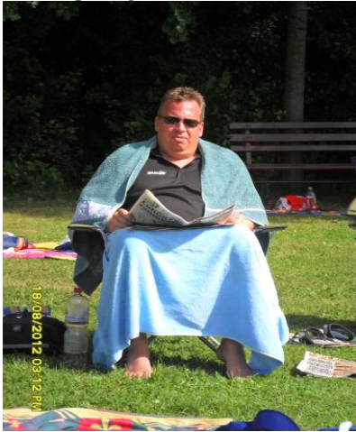
Top Goalie Smetbrö beim Relaxen

Exklusive Fotos liegen der Redaktion vor vom isländischen TopGoalie der es sich schon einmal in Deutschland bequem gemacht hat.